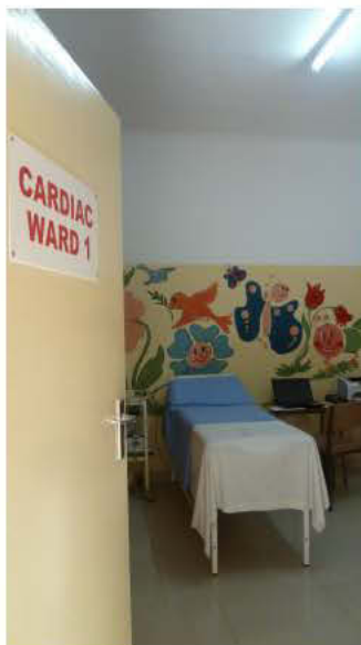
Il nuovo ambulatorio cardiologico, l'angolo nutrizionale per mamme e bambini e la camera per il riposo delle mamme