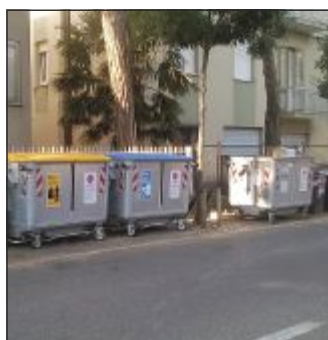
I bidoni in via Ceccarelli fotografati da Hera ieri mattina alle 8

A proposito dello sfogo di una cittadina su via Torelli per le buche e la pulizia della strada Hera risponde «che l'asfaltatura delle strade è di sua pertinenza solo nel caso in cui sia necessario ripristinare il manto stradale dopo un intervento sulle