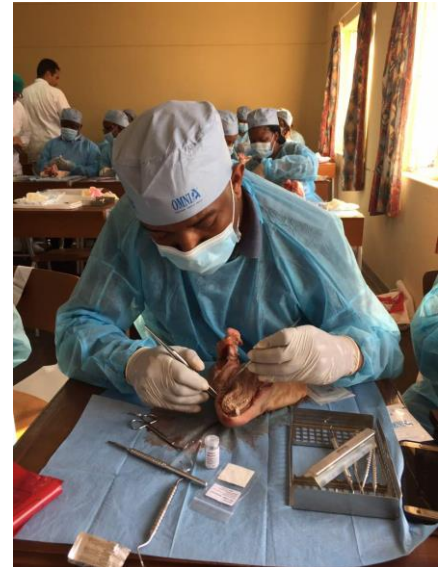
Alcuni momenti durante il simposio teorico-pratico (le esercitazioni e la sessione in diretta "live surgery")