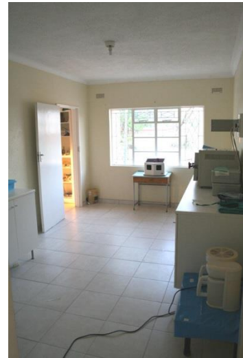
La sala di sterilizzazione