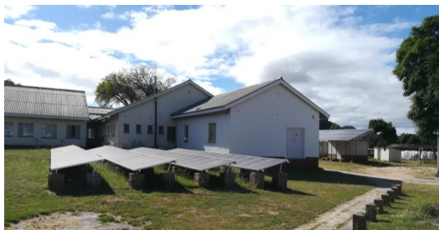
I pannelli fotovoltaici finanziati dal Campo Lavoro Missionario (Rimini)

La migliorata capacità gestionale e di analisi dei flussi finanziari acquisita in questi anni, ottenuta in gran parte grazie al sostegno da parte della FMP, ha consentito una migliore efficienza operativa della struttura e ottimizzazione delle risorse finanziarie disponibili, nonostante l'aumentata crisi economica in cui il paese versa (ulteriormente acuita a partire da Luglio-Agosto 2017).