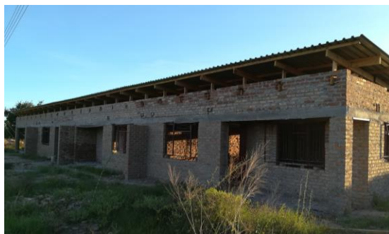
I nuovi alloggi in costruzione finanziati dal Beit Trust (Zimbabwe)